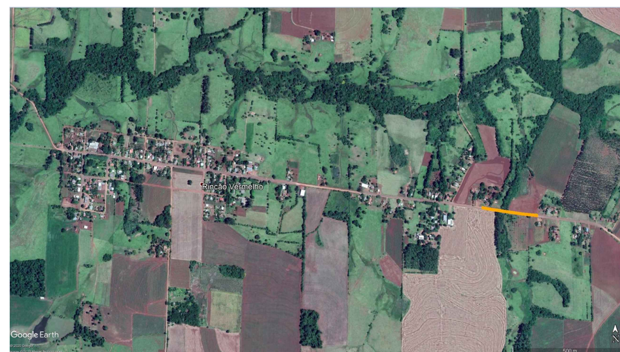
Imagem Satélite Localização